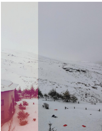
< Sierra Nevada

¡Tuvimos una excursión a Sierra Nevada y nos permitió experimentar la nieve! ¡Todos juntos y fue realmente muy divertido!